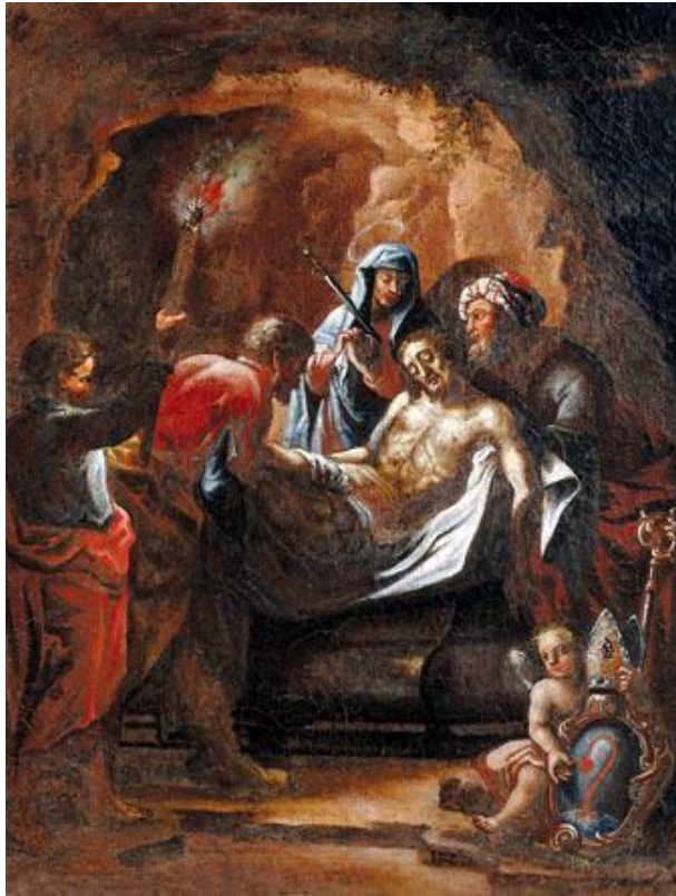
XIV stazione: Giorgio, sq Cobra.