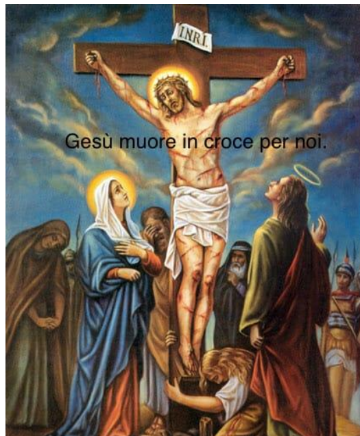
XII stazione: Giulio, sq Cobra.